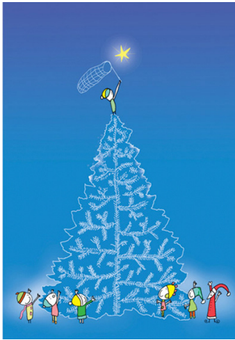
1/2023 ANDRZEJ TYLKOWSKI