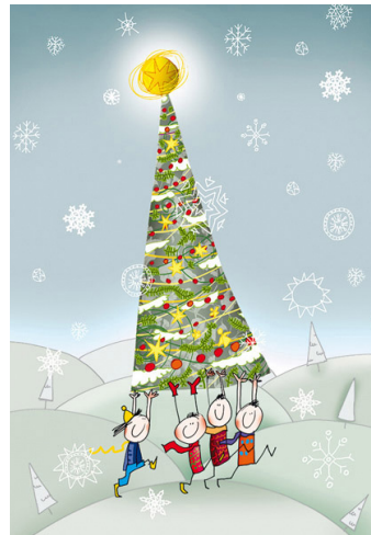
5/2023 ANDRZEJ TYLKOWSKI