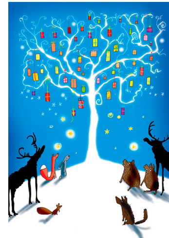
6/2023 ANDRZEJ TYLKOWSKI