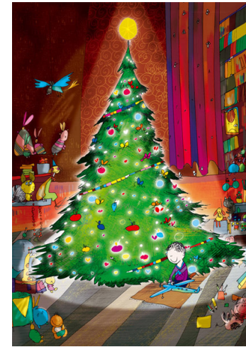
3/2023 ANDRZEJ TYLKOWSKI