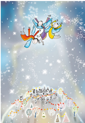
4/2023 ANDRZEJ TYLKOWSKI