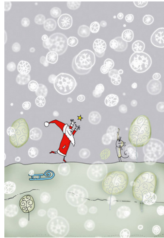
2/2023 ANDRZEJ TYLKOWSKI