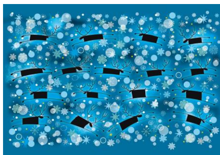
19 / 2018 ANDRZEJ TYLKOWSKI