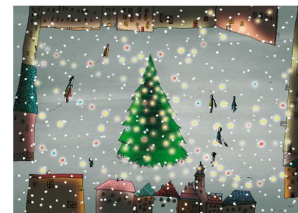
18 / 2018 ANDRZEJ TYLKOWSKI