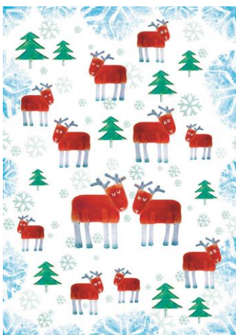
13 / 2018 AGNIESZKA HAWAŁEJ