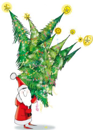
16 / 2018 ANDRZEJ TYLKOWSKI