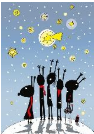
8 / 2018 ANDRZEJ TYLKOWSKI