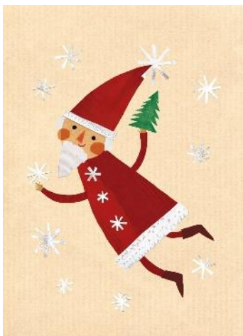
2 / 2018 AGNIESZKA ŻELEWSKA