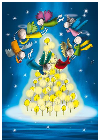
17 / 2018 ANDRZEJ TYLKOWSKI