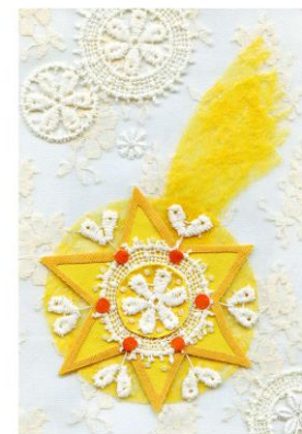
10 / 2018 EWA KOZYRA-PAWLAK