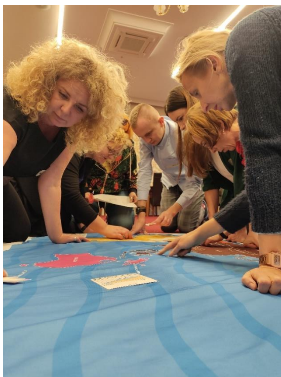
Na zdjęciach osoby uczestniczące w programie w roku szkolnym 2022/23 w trakcie szkoleń nauczycielskich.

Program realizowany jest w oparciu o założenia edukacji globalnej – więcej na temat tego obszaru przeczytać można w publikacji: www.bit.ly/PomocnikPAH_educacja_globalna .