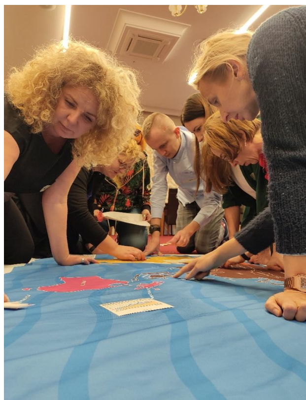
Na zdjęciach osoby uczestniczące w programie w roku szkolnym 2022/23 w trakcie szkoleń nauczycielskich.

Program realizowany jest w oparciu o założenia edukacji globalnej – więcej na temat tego obszaru przeczytać można w publikacji: www.bit.ly/PomocnikPAH_edukacja_globalna .